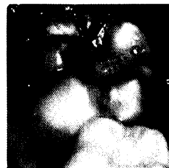
Einteilung der Schweregrade von MIH nach Wetzel und Reckel, Schweregrad 2. Beitrag A. Behrendt et al.

Wichtige Basis für die Erfolge der Prophylaxe: Aufstiegsfortbildung für die zahnmedizinische Fachangestellte 128