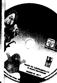
Film über Kinderprophylaxe auf DVD. „Kalle, Klops und Karies“.

Beitrag vom Verein für Zahnhygiene e.V. Seite 110